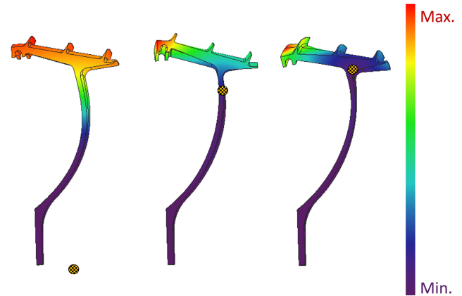
Modale Deformation Labyrinthdichtung